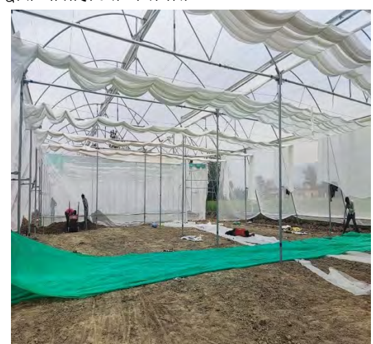
पॉलीहाउस में प्रगति स्थिति