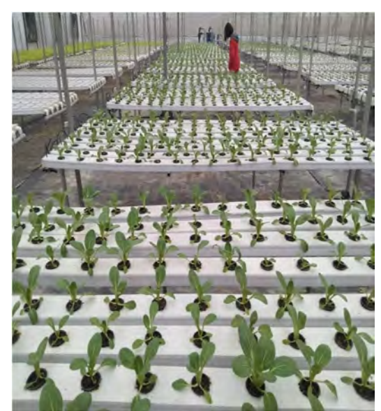
हाइड्रोपॉनिक विधि द्वारा पॉलीहाउस में प्रगति